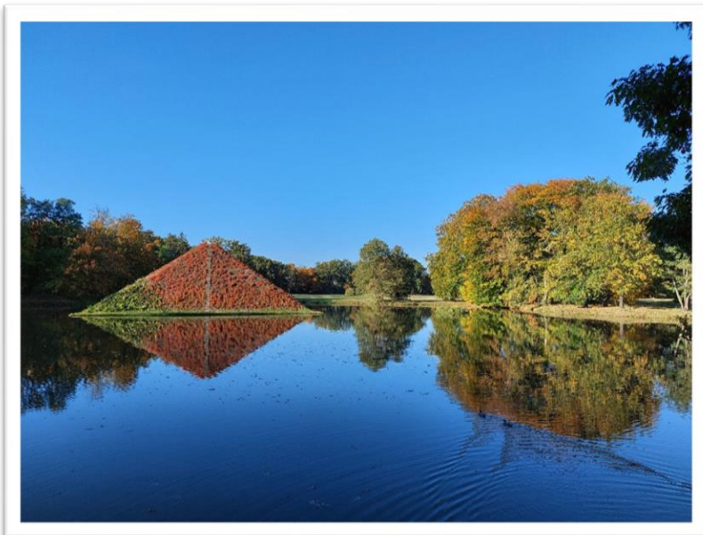
Herbstzauber im Branitzer Park